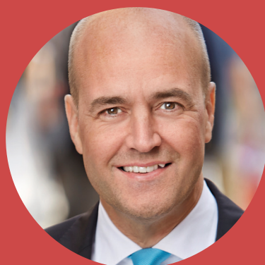
FREDRIK REINFELDT f.d. statsminister