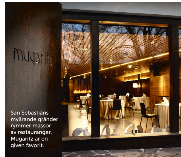
San Sebastián myllrande gränder rymmer massor av restauranger. Mugaritz är en given favorit.